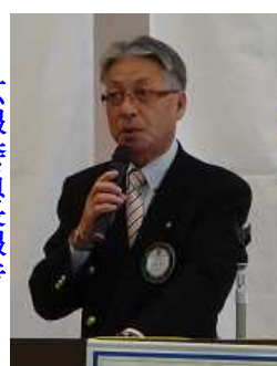
社会奉仕委員長報告