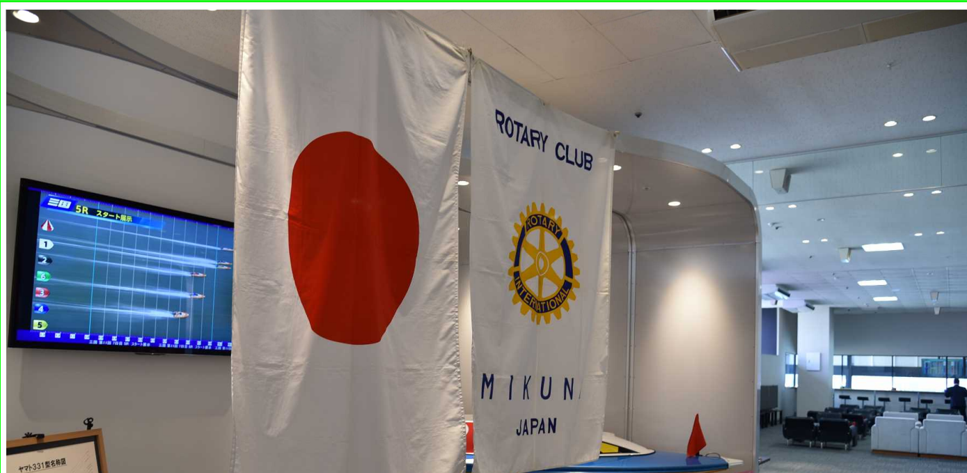
「職場見学」三国競艇場内例会会場(ROKU)内部↑正面↓左 28年間100%出席